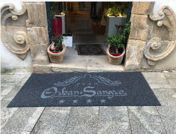
Felpudo Negro, textos y logo en Steel (acero)

Tamaño 1600 x 1000 mm Instalación en superficie