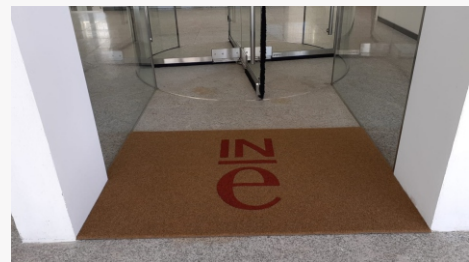
Felpudo Koko, textos y logo en rojo

Para contornas especiais de alto impacto visual.