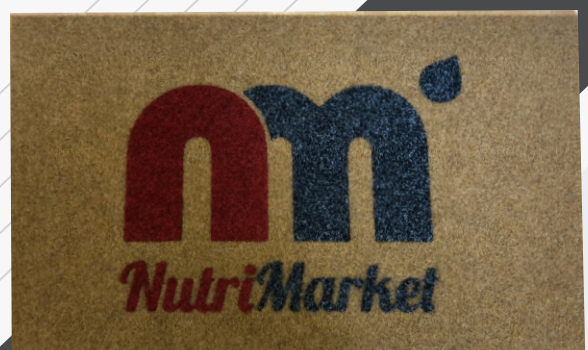
Felpudo Kokos, textos y logo en rojo/negro